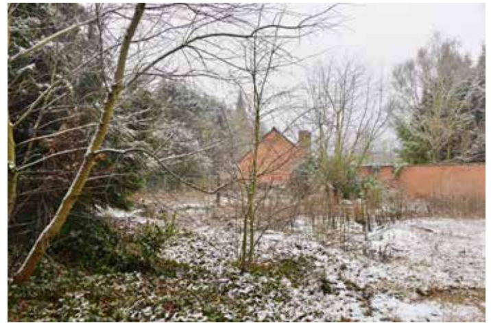
▲ Deze jungle zou binnenkort plaatsmaken voor nieuwe gebouwen.

Mede daardoor spendeerde dit gemeentebestuur al ruim 2,5 miljoen euro aan de aankoop van gebouwen, gronden en studiebuizen. Voeg daar nog minstens een miljoen aan toe eer je de voorliggend plannen echt kan uitvoeren en je begrijpt