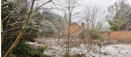
N-VA-alternatieven voor centrumvernieuwing p.2