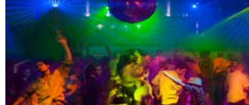
Nieuwe impulsen nodig voor De Balans p.3